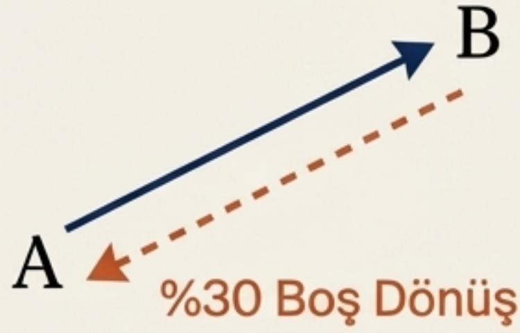
Eski Model (A-B-A)